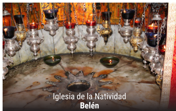
Iglesia de la Natividad Belén

Inscripción — Envíe un depósito no reembolsable de $300 junto con su formulario de inscripción y una copia de su pasaporte a la dirección indicada abajo, o utilice el código QR para inscribirse en línea. Los nombres en el formulario de inscripción y en el pasaporte deben coincidir exactamente, y los pasaportes deben tener una validez mínima de 6 meses a partir de la fecha de regreso. El pago total vence el 30/7/2026, 100 días antes de la salida.