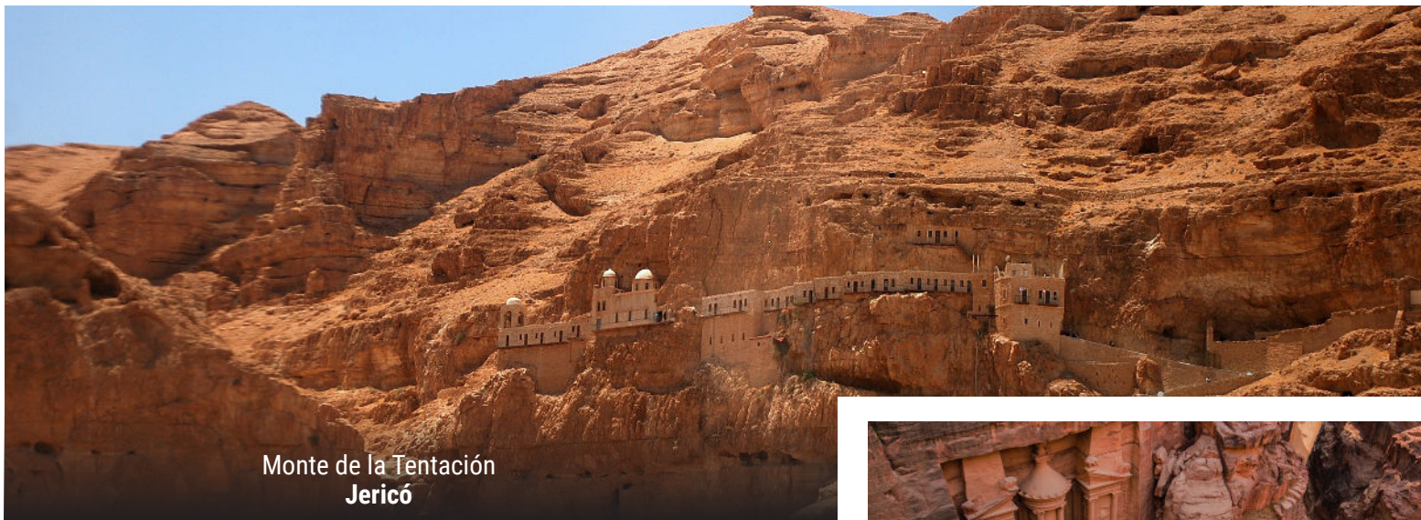
Monte de la Tentación Jericó

el río Jordán antes de detenernos en Jericó para la misa y admirar el Monte de las Tentaciones. Luego nos dirigiremos a Qumrán, hogar de los Rollos del Mar Muerto, con la oportunidad de flotar en el Mar Muerto. Después de un día de descubrimiento, regresaremos a Belén para cenar y pasar una noche tranquila en nuestro hotel en Jerusalem.