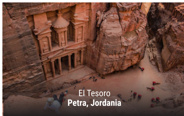
El Tesoro Petra, Jordania

Al finalizar nuestro viaje, nos dirigiremos al aeropuerto, con el corazón lleno de emoción y recuerdos para toda la vida.