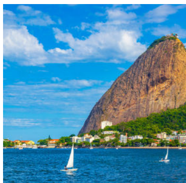
La Bahía de Guanabara