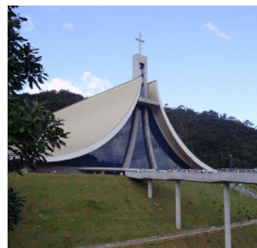
Santuario de Santa Paulina