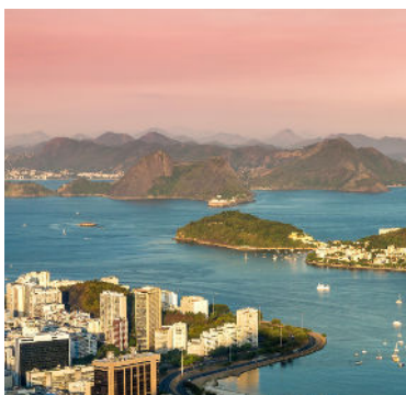
Río de Janeiro